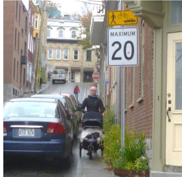
Rue Sainte-Claire (Québec)