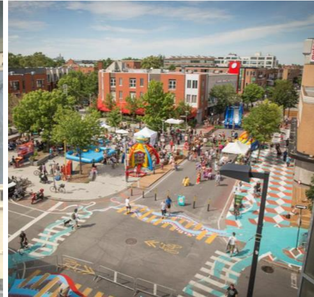
Rue Ontario/Valois (Montréal)