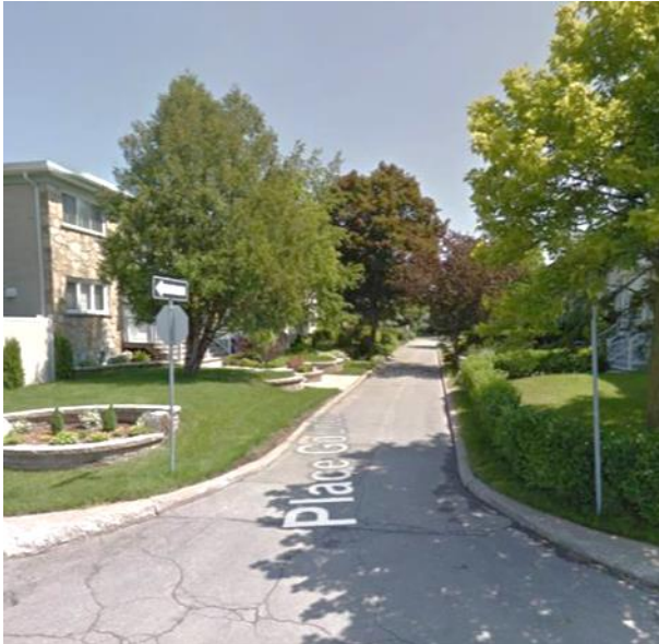
Place Gounod (Laval)